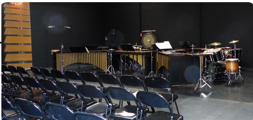
L'Hameçon • Les Percussions Claviers de Lyon

Et aussi : Avec les conservatoires et écoles de musique (voir p. 15)