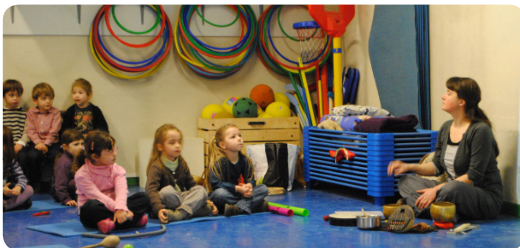
École maternelle - Oullins