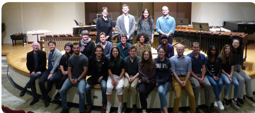
Master class avec les Percussions Claviers de Lyon • Université de Toronto