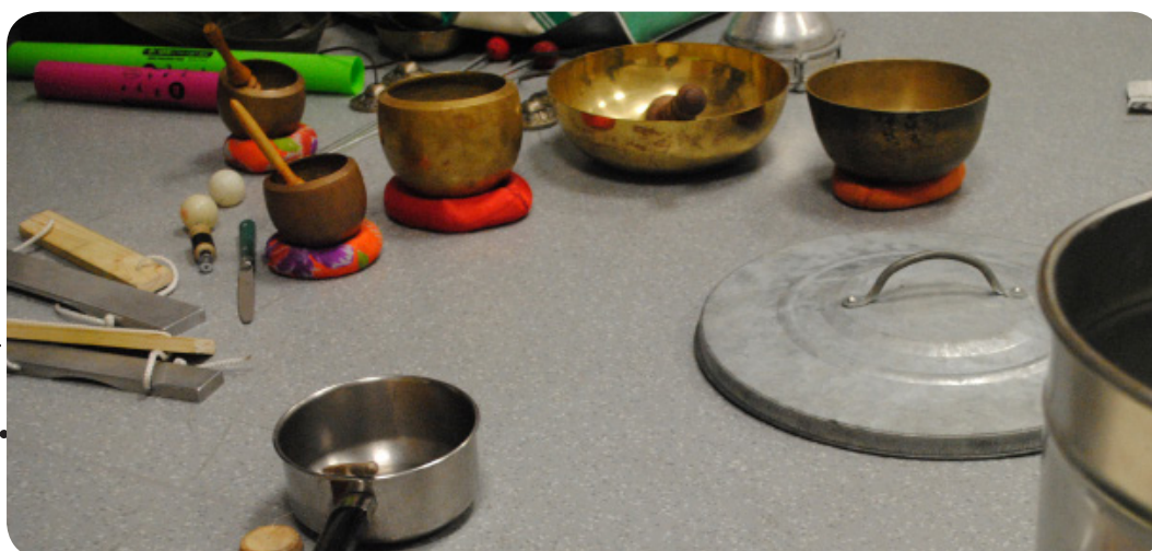
© Les Percussions Claviers de Lyon