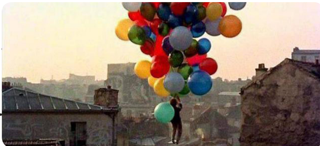
Le Ballon Rouge © Albert Lamorisse

Et aussi : atelier parents-enfants (voir p. 12)