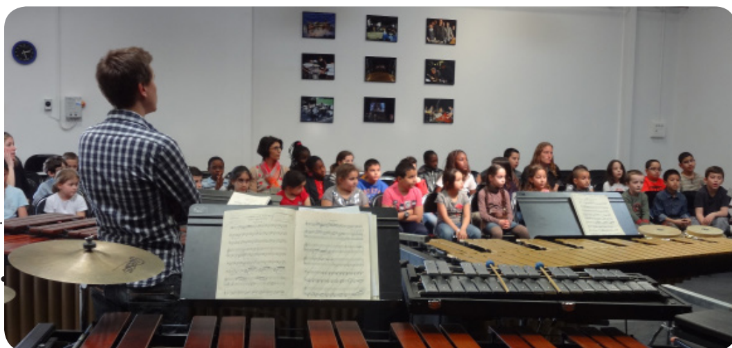
L'Hameçon © Les Percussions Claviers de Lyon