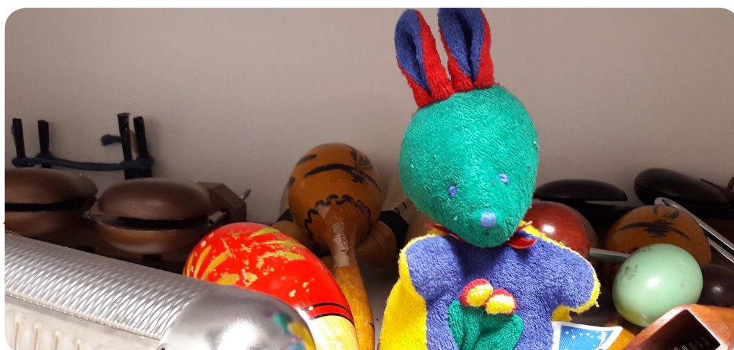
© Les Percussions Claviers de Lyon