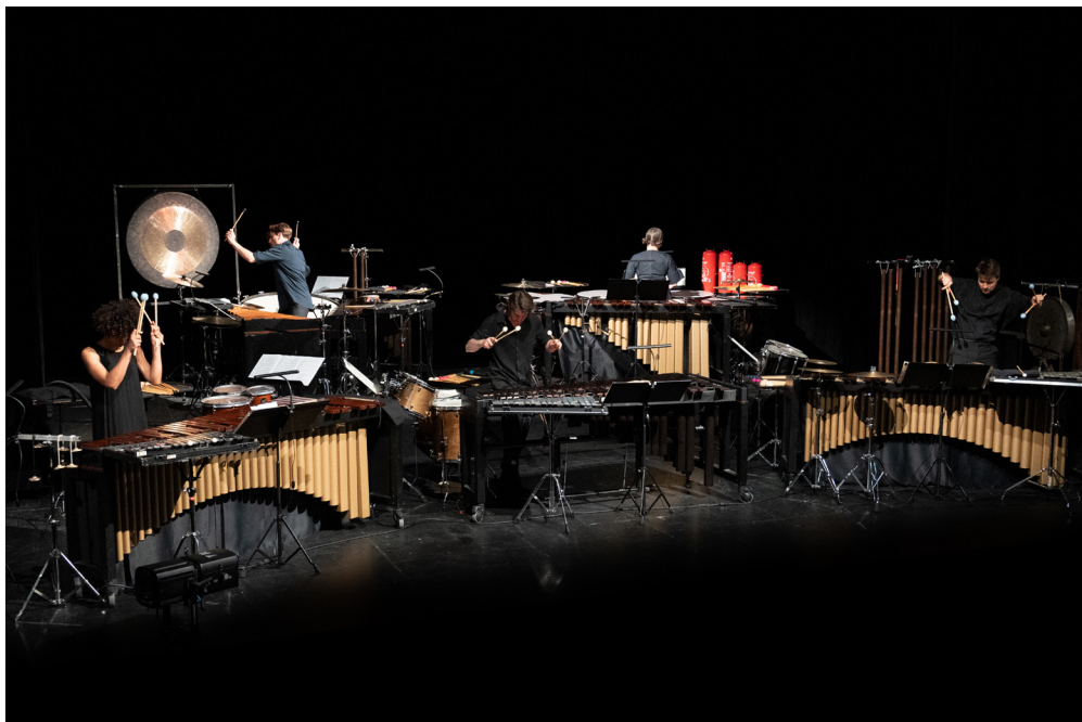
Diabes & Démons (création mai 2022) © Julie Cherki