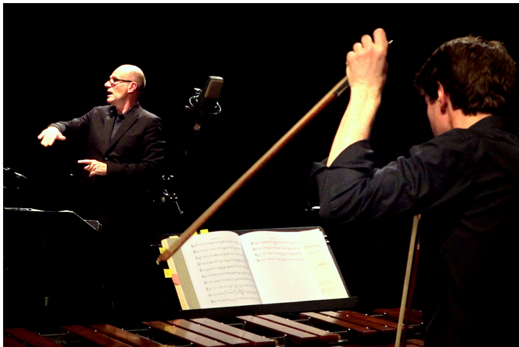
© DR - Création Avril 2019

Deux compositeurs anglais contemporains fortement marqués par l'école minimaliste complètent le programme. Graham Fitkin compose Partially Screaming , une pièce virtuose aux rythmiques magnétiques pour les Percussions Claviers de Lyon ainsi qu'une nouvelle œuvre, People , pour voix et percussions. wGavin Bryars, qui a étudié avec Cage et Feldman, signe pour sa part une pièce pour ensemble vocal et percussions. : Mistral . Commandées spécialement pour ce programme, les deux œuvres anglaises réunissant les deux ensembles ont été données en création mondiale à Odyssud-Blagnac en avril 2019.