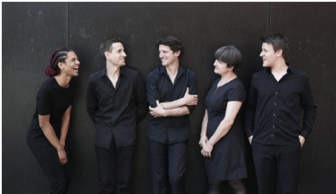
© Les Percussions Claviers de Lyon, 2019 - Cédric Roulliat

Les Percussions Claviers de Lyon sont conventionnés par le Ministère de la Culture - DRAC Auvergne-Rhône-Alpes, la Région Auvergne-Rhône-Alpes et la Ville de Lyon. Ils sont régulièrement aidés par la Spedidam, la SACEM, le FCM, l'Adami et Musique Nouvelle en Liberté pour leurs activités de concert, de spectacle et d'enregistrement. Les Percussions Claviers de Lyon sont membres de la FEVIS, du Profedim, du Bureau Export et de Futurs Composés. La Nouvelle Imprimerie Delta, Les Ateliers Guedj et Resta Jay soutiennent l'ensemble dans le cadre de son Club d'Entreprises.