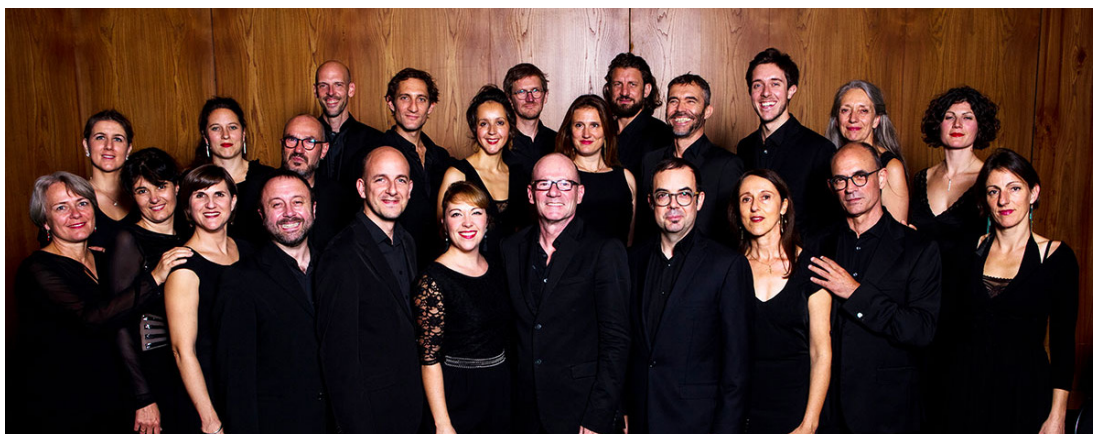
© Les éléments, 2018 - Thomas Millet

Le chœur de chambre Les éléments est un ensemble conventionné par le Ministère de la Culture - Direction Régionale des Affaires Culturelles Occitanie, par la Région Occitanie / Pyrénées-Méditerranée et par la Ville de Toulouse. Il est subventionné par le Conseil Départemental de la Haute-Garonne. Il est soutenu par la SACEM, la SPEDIDAM, l'ADAMI et Musique Nouvelle en Liberté. Les éléments sont membres de la FEVIS, du PROFEDIM et de Futurs Composés.