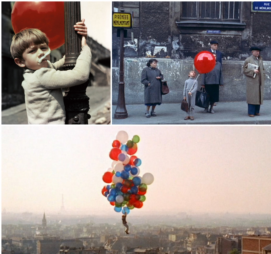
Le Ballon Rouge (images extraites du film) © Albert Lamorisse

Nous voilà transportés à Paris, dans le Ménilmontant des années 1950. Pascal, un garçon de 6 ans, libère d'un réverbère un ballon de baudruche qui prend vie entre ses mains. Une étonnante complicité entre le poulbot et le jouet suscite la curiosité de son entourage... Aux sons de leurs marimbas, vibraphones et xylophones, les Percussions Claviers de Lyon invitent petits et grands à embarquer dans l'univers poétique et magique du film d'Albert Lamorisse, oscarisé en 1957.